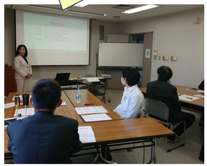
▲異業種の方々との交流の場となり、視野が広がります